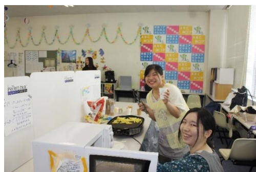
<熱々ポテトいかがですか〜>