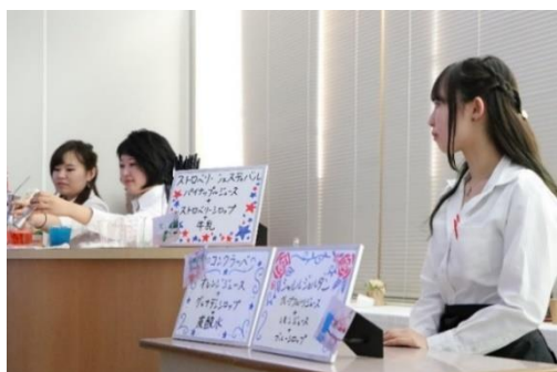
<美味しいカクテル作ってま〜す>

今年は、初めて『WANTED!!』という全校イベントが行われました。このゲームは、与えられたわずかな情報から条件に合う学生を探しあてるといったゲームです。お客様が学生たちに聞き込みをしている姿も多く見られ、地域の方々と交流を深めることができ、今回の学校祭も大成功でした。