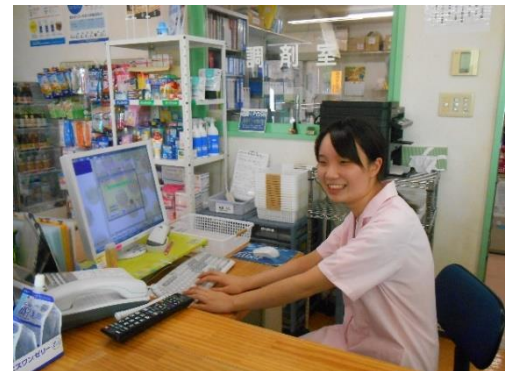
<レセプト入力作業中>