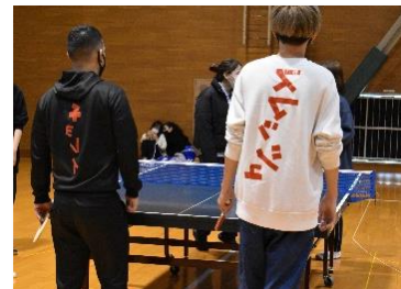
<スポーツ大会の様子>