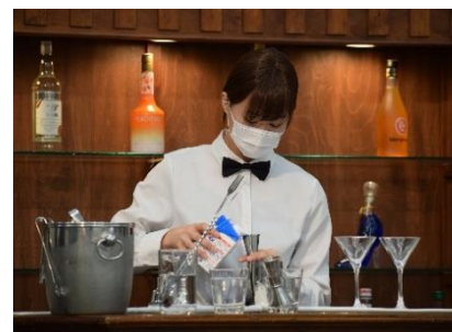
<カクテルコンペティション当日の様子>