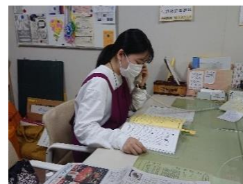
<インターンシップの様子>