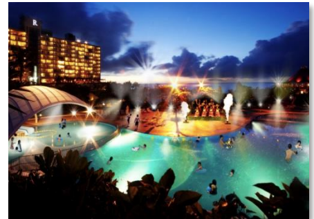
〈ルネッサンスリゾートオキナワ〉