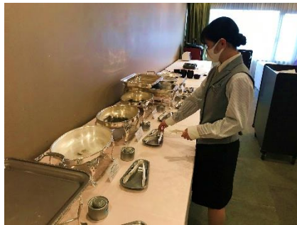
〈メトロポリタン秋田〉