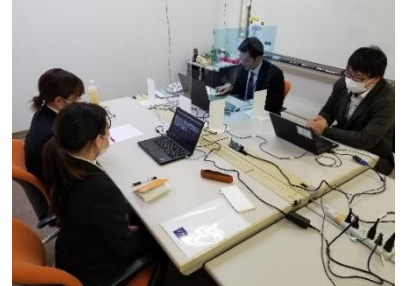
〈企業でのインターンシップ〉

今回、インターンシップを受け入れてくださった県内企業の皆様、この場をお借りしてお礼申し上げます。短い期間でしたがありがとうございました。