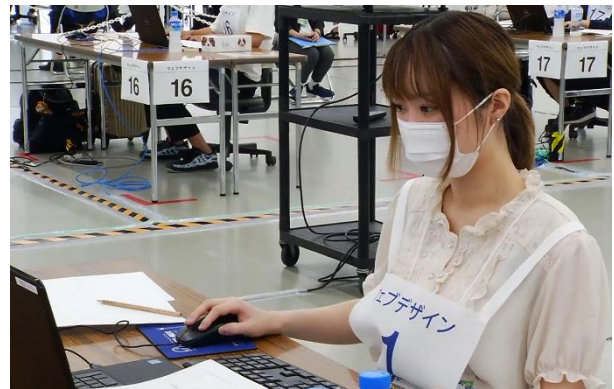
< ウェブデザイン部門の選手 >