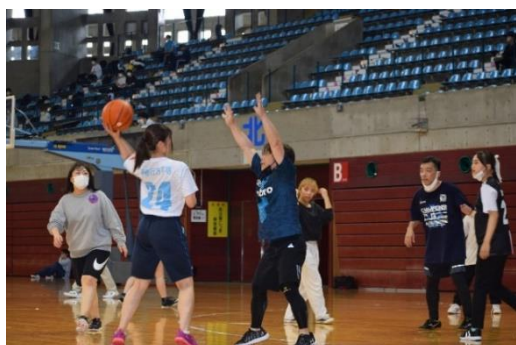
<学生チーム 対 先生チーム>

6月28日(火)にCNAアリーナ★あきた(秋田市立体育館)にて春のスポーツ大会を開催しました。今回のスポーツ大会では障害物リレーやスポーツ以外として学校に関する〇×クイズの競技が追加され、これまでとは一味違った雰囲気の中で各学科の結束を強めることができました。先生方を含めた全チームが優勝を目指して、白熱した戦いを繰り広げました。大会の結果は、先生チームが総合優勝を勝ち取りました！秋のスポーツ大会も楽しみですね♪