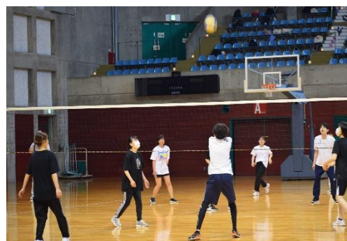
<バレーボールの様子>