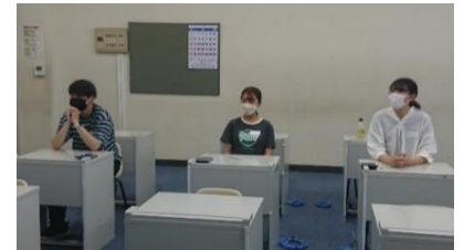
< 競技前の様子 >

この大会はチームでの参加となるため協調性を培ういい機会となるので、来年、後輩の皆さんには協力し合って念願の“優勝”を果たしてほしいと思います。