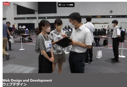
<先生と学生の最終確認>