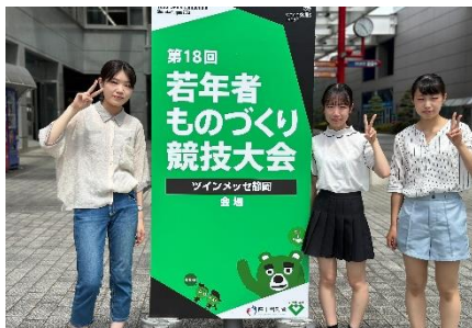
<会場入りしました>