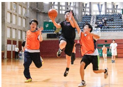
<レイアップシュート>