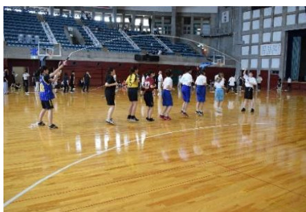
<みんなでジャンプ>