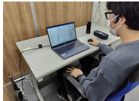
〈プログラミング確認作業〉