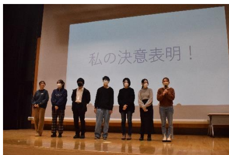
<代表者が新年の目標を発表>