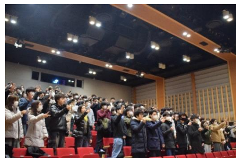
<恒例の秋コアじゃんけん>