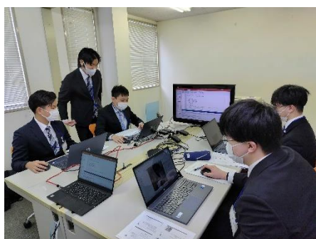
(株式会社コアでのインターン)