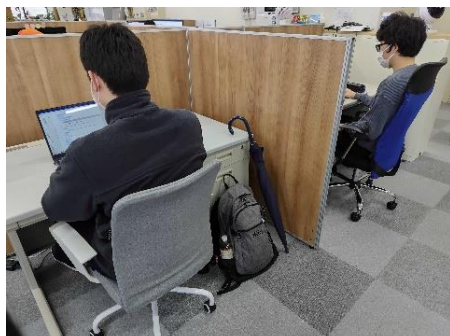
〈仕事に集中できた職場環境〉